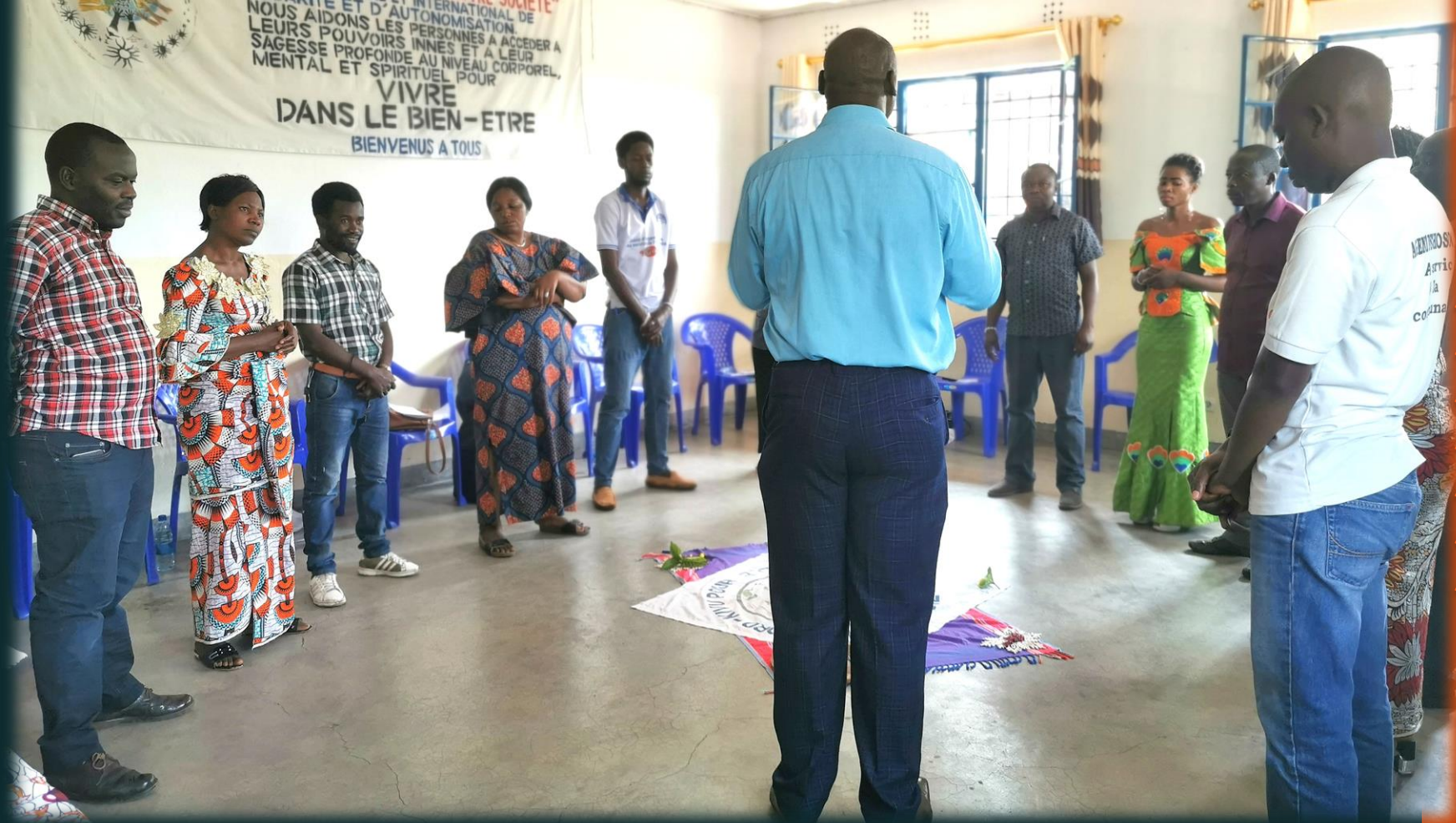
Les participants dans la salle de formation