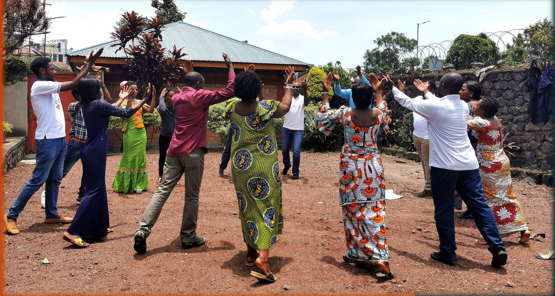
Exercice «la Douche de lumière »