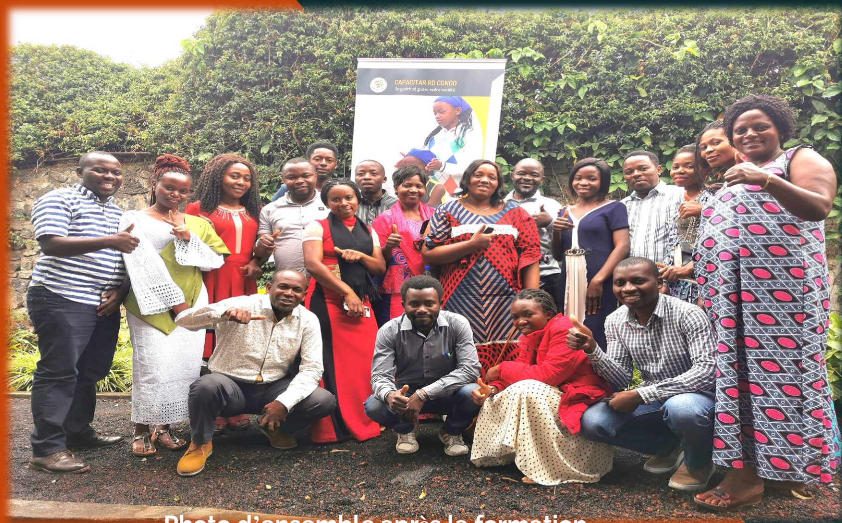
Photo d'ensemble après la formation