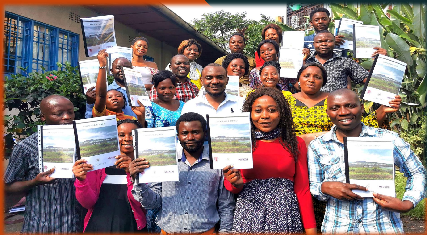
Les participants à la formation, chacun avec son module de formation