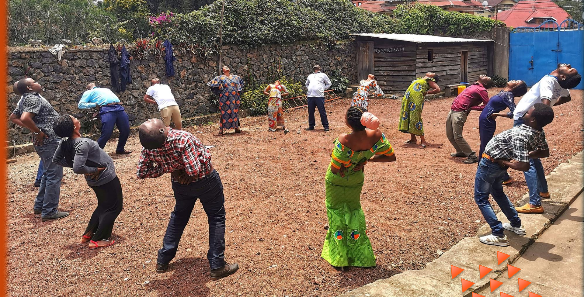
Exercice d'ensemble de Pal Dan Gum